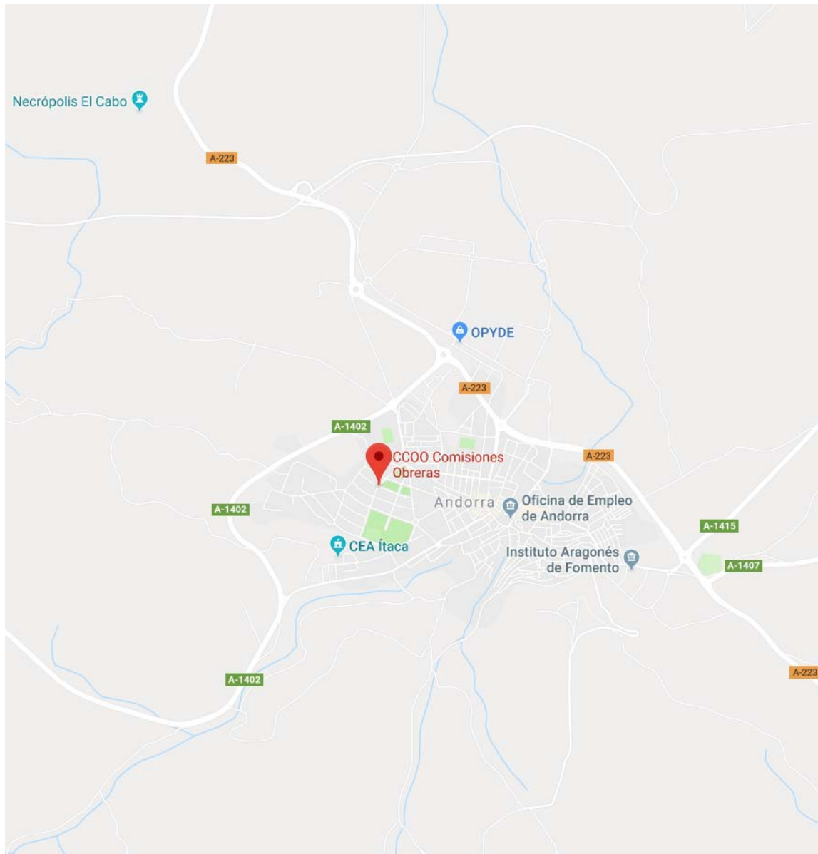
Ilustración 1. Situación. SEDE DE COMISIONES OBRERAS