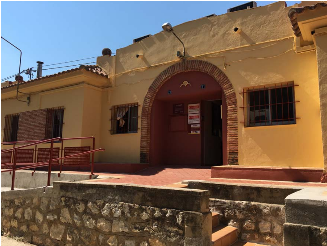
Ilustración 9. Fachada