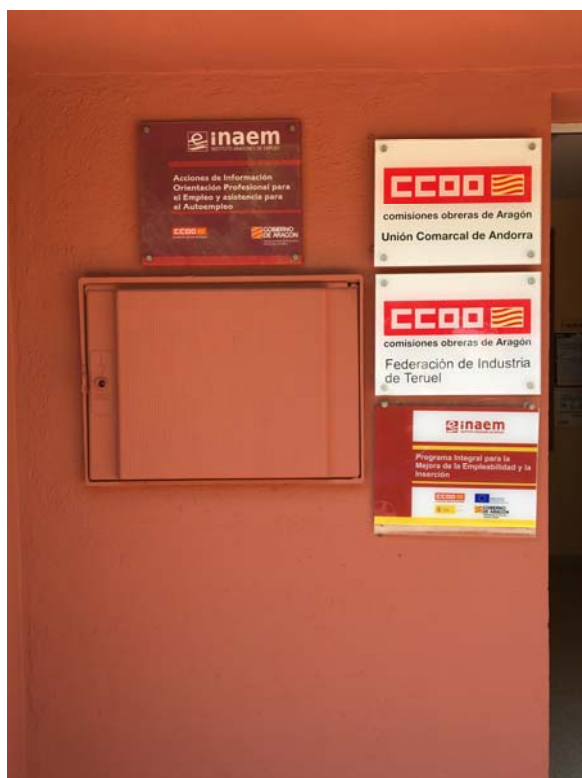
Ilustración 10. Situación del contador