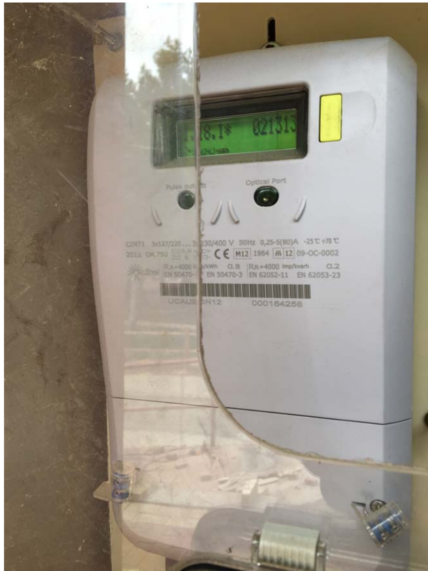
Ilustración 11. Contador